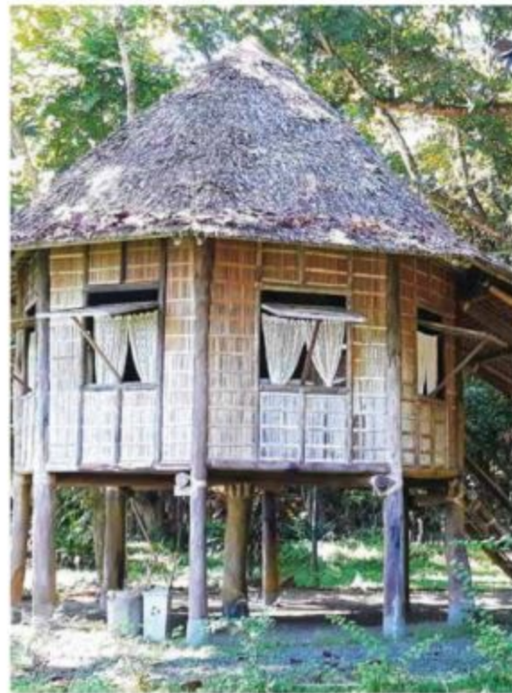
Replika sa otso kantos nga balay nga hinimo ni Rizal ug maoy gigamit niyang klinika sa pagpanambal.