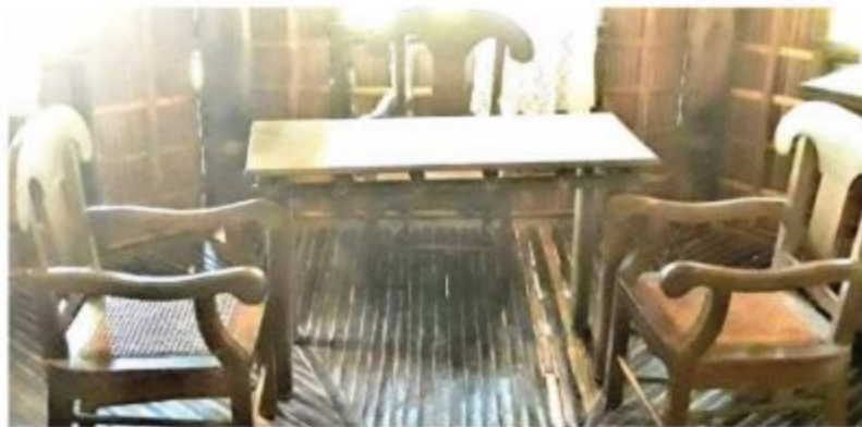
Lugar diin abi-abihon ni Jose Rizal ang pasyente.

sa Katipunan, giakusahan si Jose Rizal isip usa sa nagmugna sa maong kapunongan. Gitara! siya sa Gobyernong Espanyol nga maoy nagdumala sa Pilipinas niadtong panahona sa sala nga pag-agni aron sa pag-alsa, rebelyon ug pakigkonsabo batok sa nahauna. Giakusahan siya nga sad-an dianang tulo ka salaod maong gilabay siya sa Dapitan, diin siya naghulat na lamang