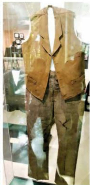
Orihinal nga sinina ni Jose Rizal.