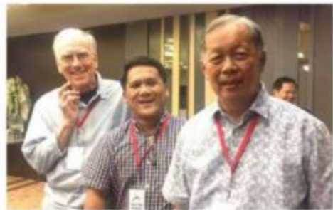
Ang tagsulat (tunga) uban ni National Artist Resil Mojares ug usa ka dinapit.

Teyatro/Kasaysayang Pangkatilinghan – Theater in Society, Society in Theater: Social History of a Cebuano Village, 1840-1940. Usa ka sumbaran, inobatbo, pulko pagkadukiduki nga trabaho nga