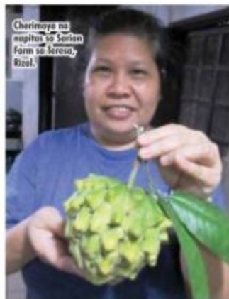
Cherimoya na napitas sa Sarin Farm sa Teresa, Rizal.