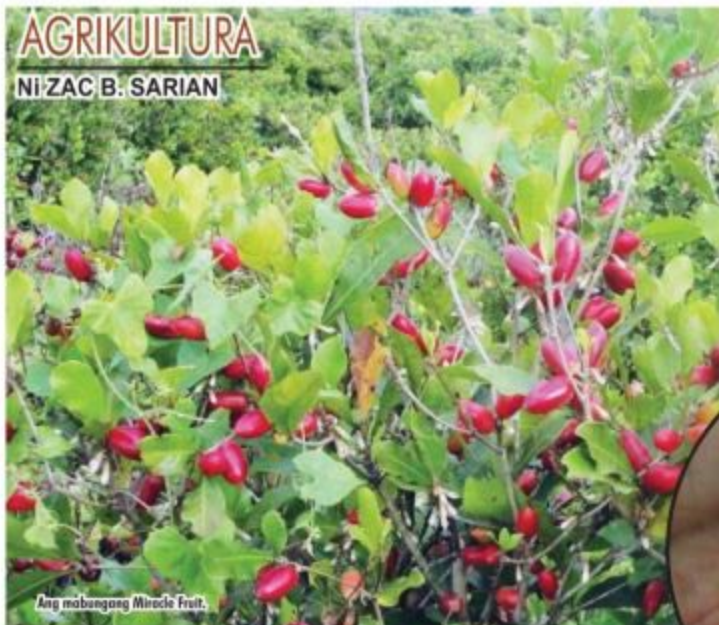
Ang nabungang Miracle Fruit.