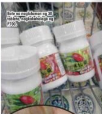
Bata na naglalaman ng 30 tableta, nagkakahalaga ng P700.