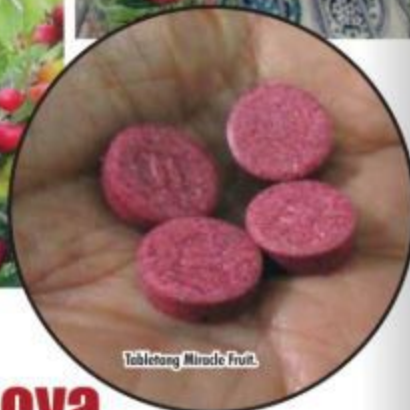
Tabletang Miracle Fruit.