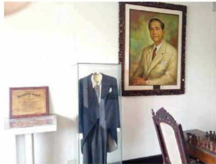
Ang kabilang barang ni CPG.