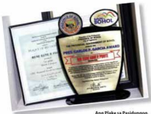
Ang Plake sa Pasidungog.

Ang maong pasidungog gidasonan pa sa hiniusang pagtarnod sa iyang mga katagilungod pinaagi sa Resolution No. 606 sa Sangguniang Bayan sa Loon nga nag-abiba ug nagbayaw usab sa iyang pagka "Most Outstanding Loonanon in the Field of Literary Arts".