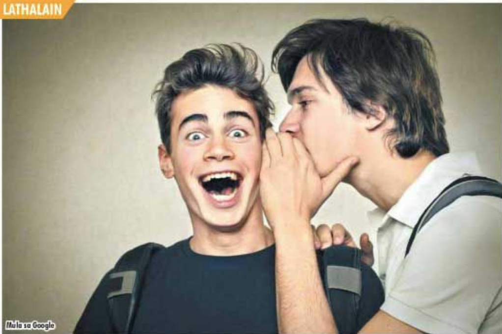
Mula sa Google