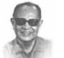
Amado V. Hernandez

Napawalang sala sa kasong rebellion with murder, arson and robbery ang manunulat at labor leader na si Amado V. Hernandez noong Mayo 30, 1964.