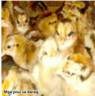
Mga piso sa darag.