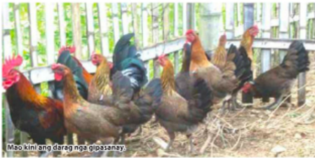
Mao kini ang darag nga gipasanay.