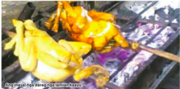
Ang inasal nga darag nga lamian kaayo.

Ang darag sa Panay ang naghinugtong nga na- putli nga lumadnong manok. Ang buot ipasabot niini, parchas ra ang kolor sa