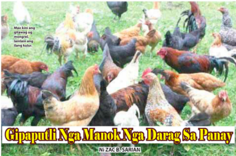
Mao kini ang gitawag og mongrel, lainlain ang ilang kolor.