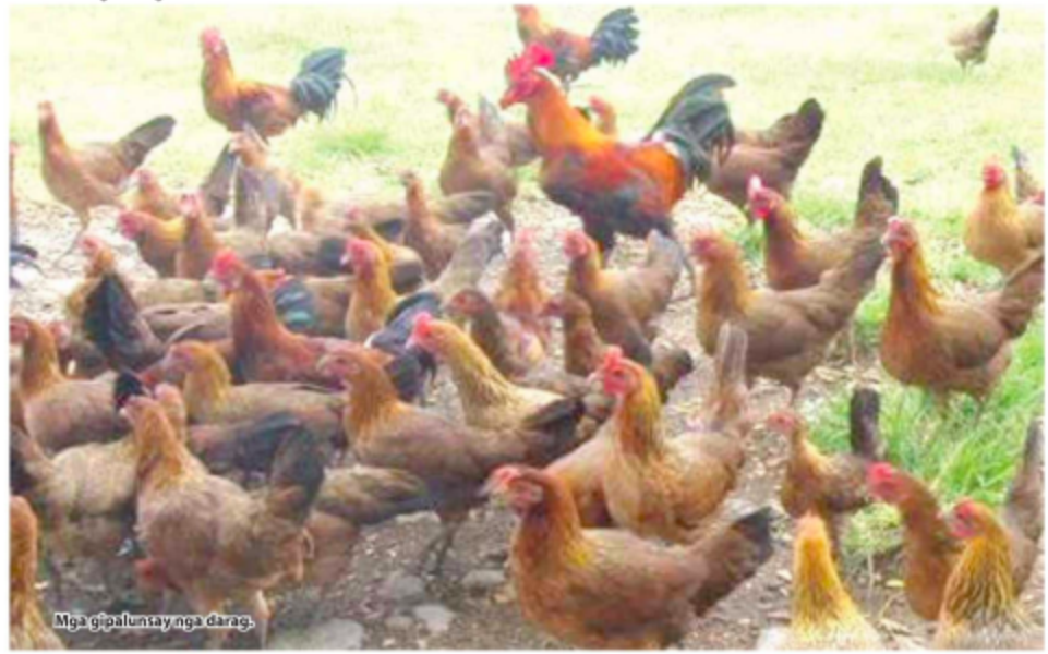
Mga gipalunsay nga darag.