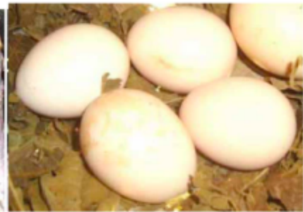
Gipalumloman nga itlog sa darag.

ilang mga balhibo, puparehas ra ang panglawas ug maingon nga paspos modagko ug mas daghan ang mahatag nga itlog, ug dili kay parchas sa naandang 110 ka itlog matag himungaan sa usa ka tuig.