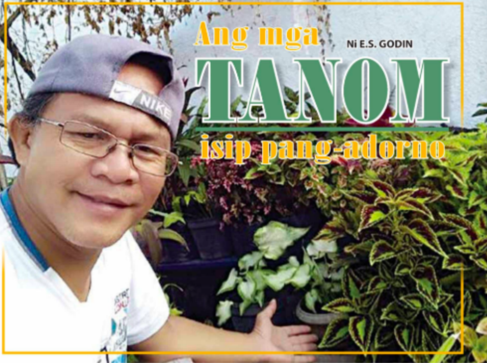
Ang tagsulat uban sa lainlaing klase sa Mayana.

ANG mga tanom maoy nag-unang elemento sa pagpatabom sa usa ka dapit—balay man, opisina, mga hotel, resort, restawran, mga parke, ubp. Pobre ra sab kaiyo ang usa ka balay nga walay paambong nga mga tanom. Ug wala pa tingali bisan usa lang ka landscaper nga wala mogamit og tanom sa iyang arte sa pagpatabom. Busa, dayag nga dakog potensiyal ang pag-atiman og mga tanom isip tinubdan sa kita.