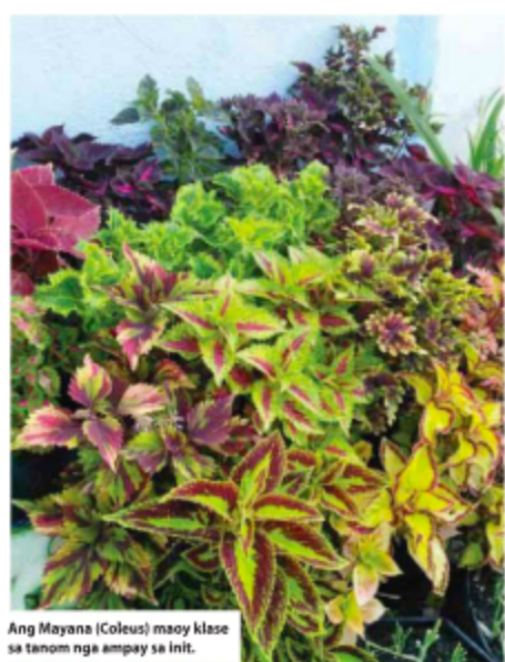
Ang Mayana (Coleus) maoy klase sa tanom nga ampay sa init.