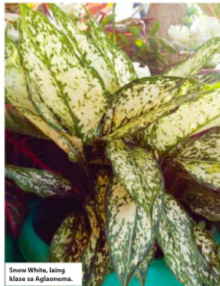
Snow White, laing klase sa Aglaonema.