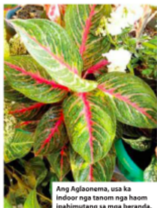
Ang Aglaonema, usa ka indoor nga tanom nga haom ipahimutang sa mga beranda.