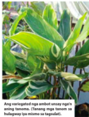
Ang variegated nga ambot unsay nga ining tanom. (Tanang mga tanom sa hulagway iya mismo sa tagsulat).

Sa laktod nga pagkasulti, dili magpaturagas sa pagpahimutang sa mga tanom. Kay kon magsagobay lang ang mga tanom sa walay pagsuhid kon indoor ba o outdoor nga klase, seguradong dili kini mosalir. Kon dili man gani mangamatay, lagmit managtugoy lang