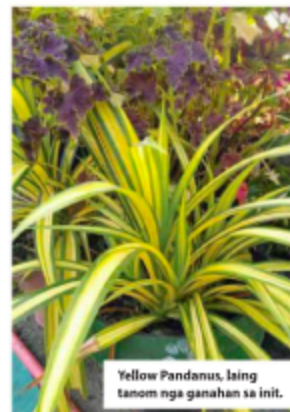
Yellow Pandanus, laing tanom nga ganahan sa init.