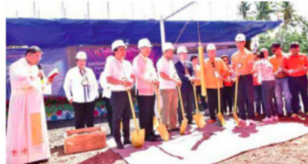
Ang simbolikong Groundbreaking ceremony.