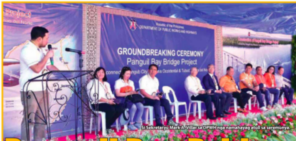
Si Sekretaryo Mark A. Villar sa DPWH nga namahayag atoli sa seremonya.