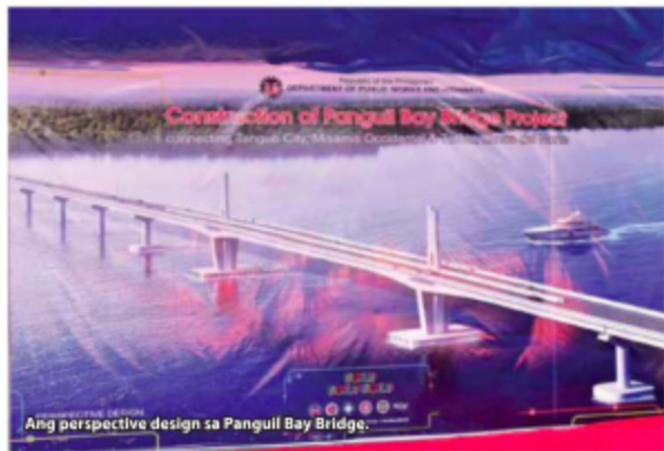
Ang perspective design sa Panguil Bay Bridge.

Apan ang maong pinangandoy kaayong tulay sa katawhan wala gayod mahimo sulod sa nanglabayng katuigan tungod kay ang problema sa dako kaayong kantidad gikinahanglan sa pagpahimo wala gayod masalbad. Ang Tangub nahimo nang mauswagong siyudad apan ang pinangandoy kaayong tulay sa katawhan nagpabilin