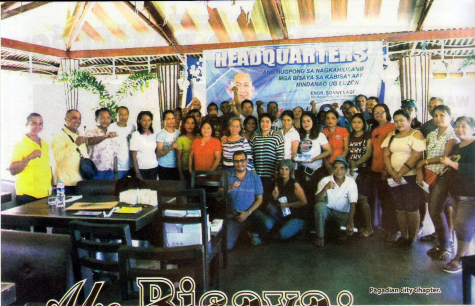
Pagadian City Chapter.